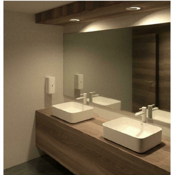
2 Aseo mixto 1.2 1:1